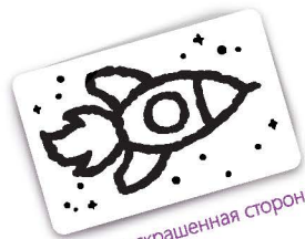
Нераскрашенная сторона карты