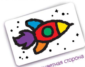
Разноцветная сторона карты

На одной стороне карты — нераскрашенная картинка, а на другой — та же картинка, только в раскрашенном виде. Каждая картинка состоит из 6 областей.